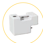
Wassertank 5l 4250.320