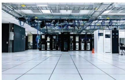
Rechenzentren und Fernmeldetechnik