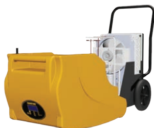
Gehäuse für Reinigungszwecke leicht zu öffnen

Der hocheffiziente Luftentfeuchter DHP 55 ist ideal für kleine Leckagen, Überschwemmungen und andere Trocknungseinsätze im Bau-, Industrie- oder Wohnbereich. Konzipiert für den professionellen Einsatz bei Verleihern, Baufirmen und mehr, macht das korrosionsbeständige, rotationsgeformte Gehäuse die Geräte sehr robust und damit perfekt geeignet für eine Vielzahl von schwierigen Arbeitsbedingungen. Beispiele hierfür sind Bereiche wie Keller, Lagerhallen für die Lebensmittellagerung, Archive, Museen, Bibliotheken, Garagen und Trockenräume. Besonders geeignet ist der DHP 55 für die Bau- und Wasserschadensanierung.